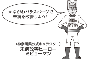
(神奈川県公式キャラクター) 未病改善ヒーロー ミビョーマン